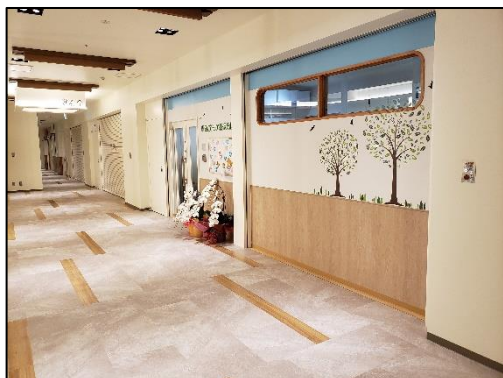
公益床活用（小規模保育事業）